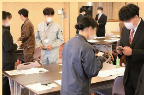
新入社員研修の開催

「経営支援」「コスト削減」「人脈形成」などを中心に50種類以上の経営サポートメニューで多角的に貴社の経営をサポートします。